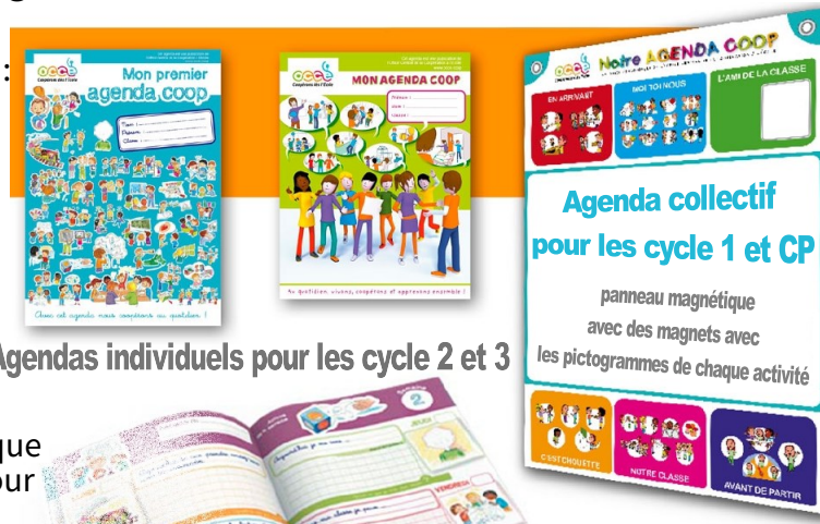
Agendas individuels pour les cycle 2 et 3

Chaque agenda est accompagné d'un guide pédagogique et d'annexes numériques, ainsi que de fiches papier pour le cycle 1.